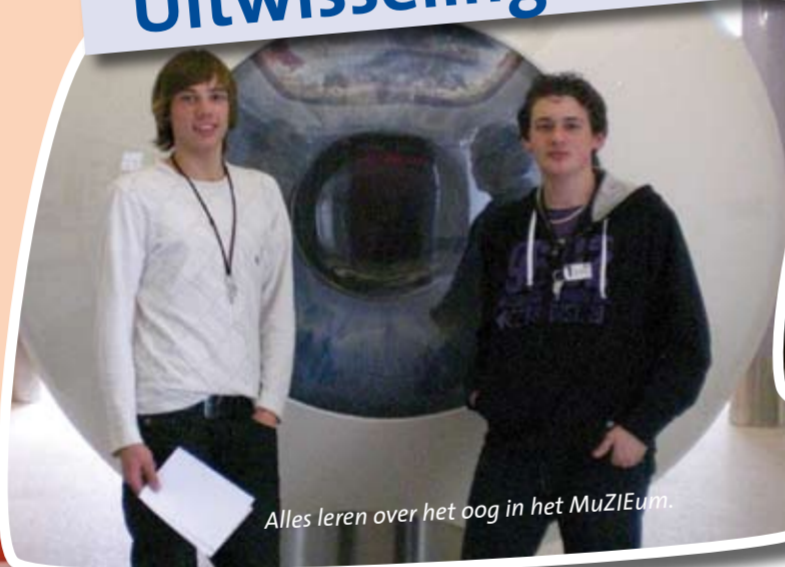
Alles leren over het oog in het MuZIEum.

Woensdag vertrok de groep naar Amsterdam om in de binnenstad onder leiding van een gids een historische rondwandeling te maken en allerlei verhalen te horen over wat er achter de panden, straten en grachten schuil gaat.