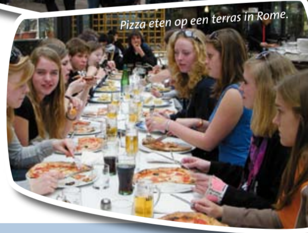
Pizza eten op een terras in Rome.