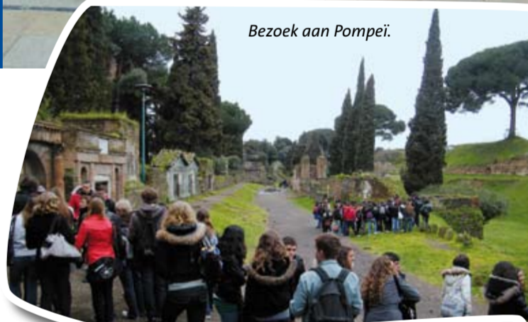
Bezoek aan Pompeii.

De derde belevenis komt nog: als de Romeinen naar Nederland komen. In september zijn zij onze gasten, leren ze ons land en onze manier van leven kennen. Dan gaan we proberen wat meer tempo in hun leven te brengen. Daarom, ciao e a presto!